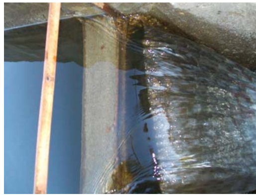
Figura 3: Pileta de engorde