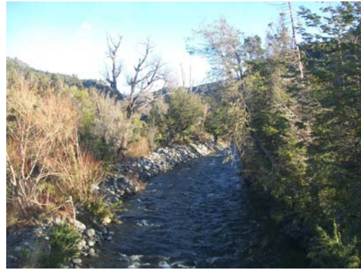
Figuras 1 y 2: Arroyo Baguilt.